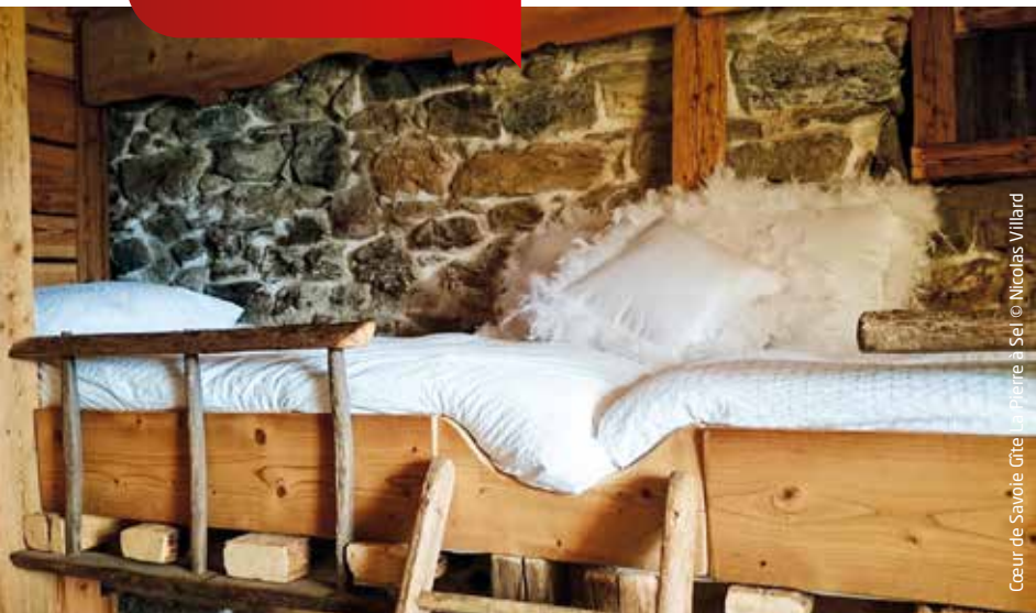
Coeur de Savoie Gîte © Pierre & Sel © Nicolas Villard