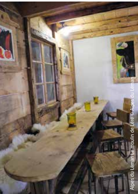
Alpes du Léman Le moulin de Léré