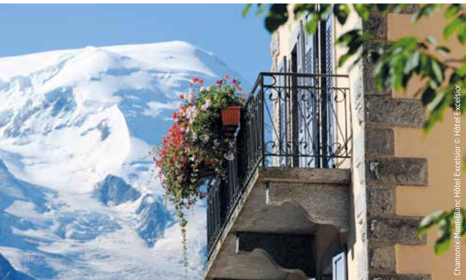
Chamonix-Mont-Blanc Hôtel Excelsior

◆ Situé aux Tines, non loin du golf de Chamonix-Mont-Blanc, l'hôtel Excelsior fait peau neuve, après une complète rénovation et des travaux d'agrandissement. Le nouvel hôtel du groupe Maranatha proposera 79 chambres et devrait se voir attribuer un classement 4*.