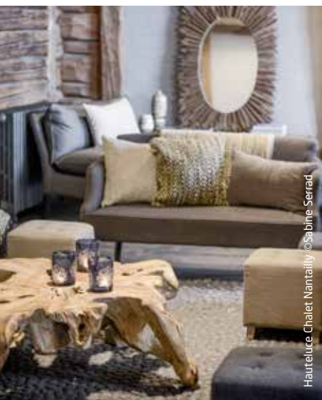
Hauteluce Chalet Nantailly