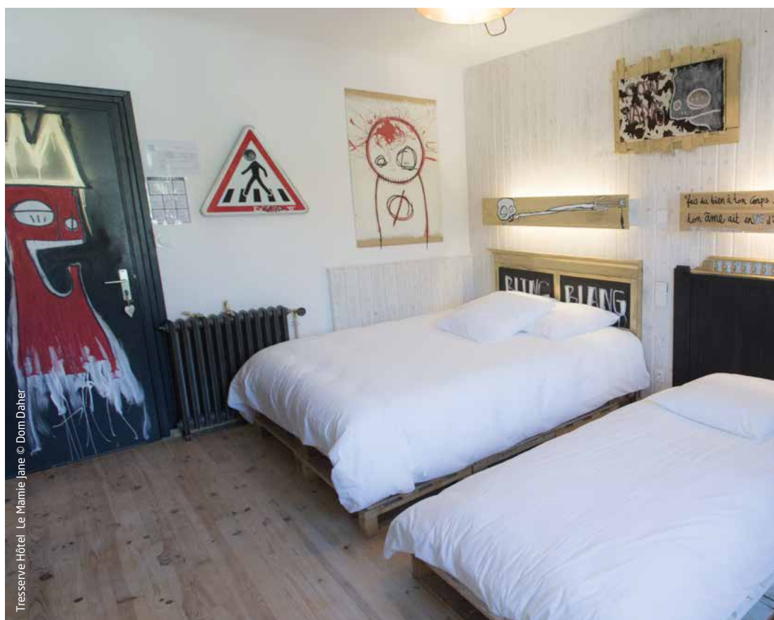
Tresserve Hôtel Le Mamie Jane

Primé dans la catégorie Petits hôtels en France de TripAdvisor, La Bergerie 4* est le nouveau "it hotel" de Morzine-Avoriaz. Côté déco, les propriétaires ont souhaité apporter clarté, couleurs et fluidité en jouant sur l'alliance du contemporain et du vintage. Twist réussi avec l'association entre vieux bois et couleurs vives des canapés, combinée à la modernité de la cheminée, des poteaux en béton ciré et des luminaires originaux. On aime la bibliothèque évolutive créée à partir d'un traitement des murs avec des claustras à lames horizontales auxquelles se fixent des tablettes amovibles.