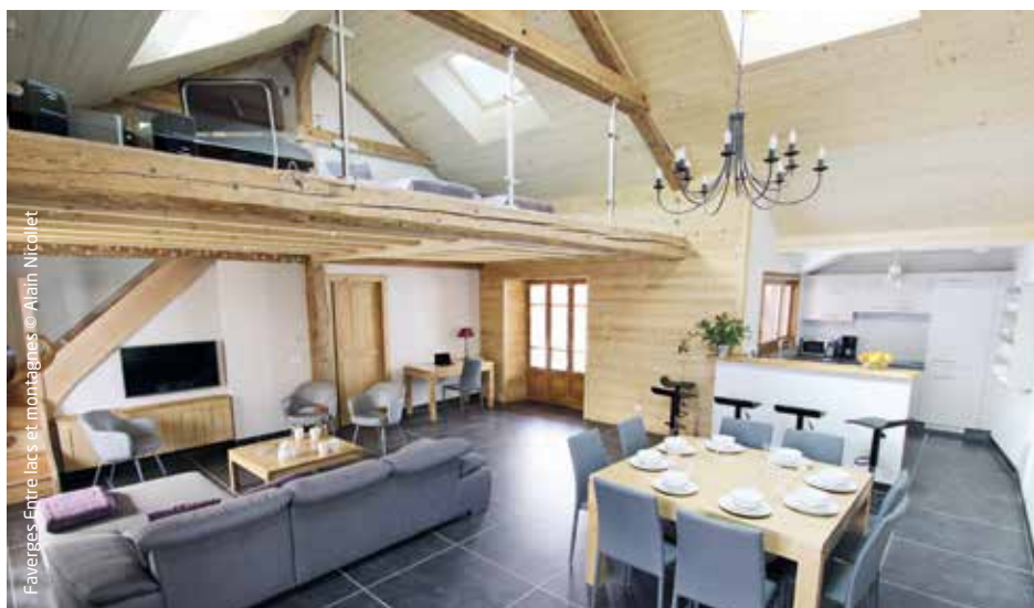
Faverges Entre lac et montagnes

◆ Chaleureux cachet campagnard pour le Gîte des Sources d'Arvey du Pays d'Albertville, dans le Parc naturel régional des Bauges. Dans une superbe propriété de 5 000 m 2 , cette maison de maître de grand confort offre 5 chambres, une triple terrasse et un espace bien-être, avec sauna et bassin d'eau de source, le tout sur 240 m 2 .