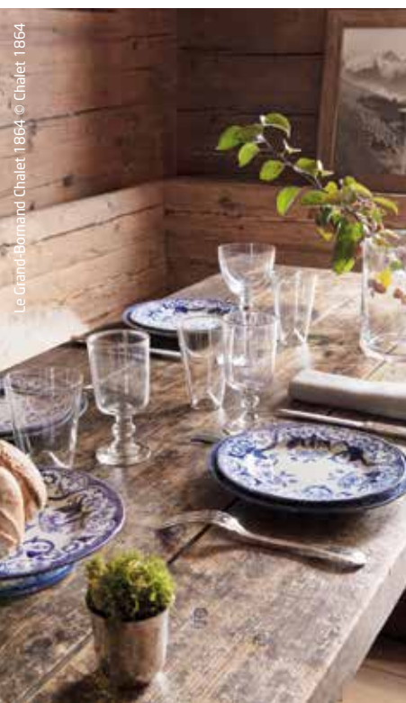
Le Grand-Dorland Chalet, 1864